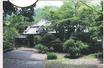
三浦邸 (椎ノ木御殿)