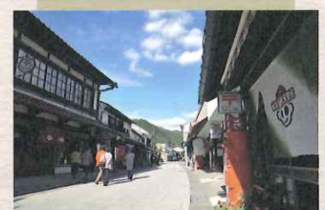
勝山町並保存地区